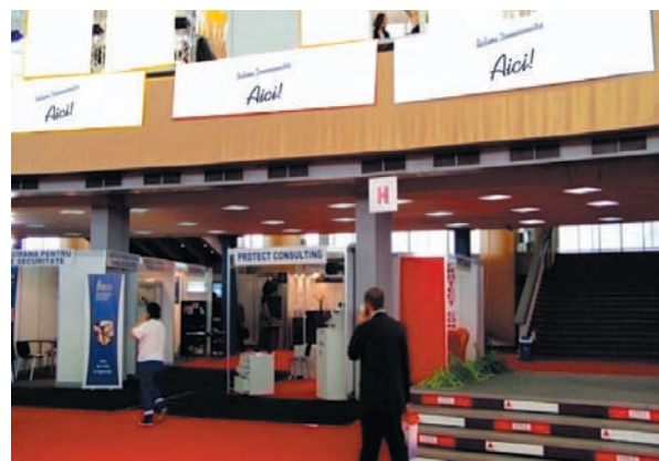
AFISARE BANNERE PAVILION A, FRIZA 4.50