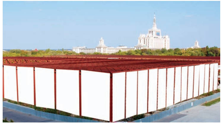
AFISARE BANNERE PAVILION B