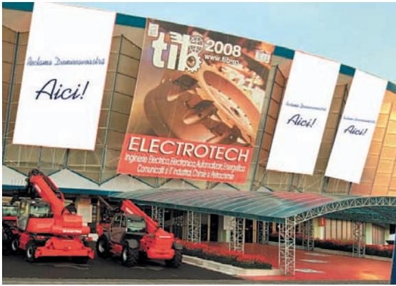
AFISARE BANNERE PE FATADA PAVILIONULUI A