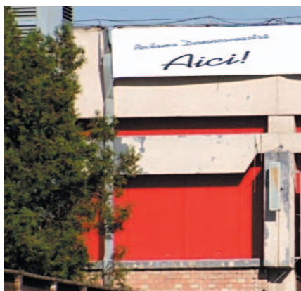
AFISARE BANNERE PE FATADA PAVILIONULUI C4